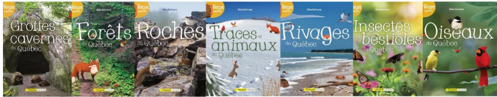
La collection Mes Docs pour emporter de Rhéa Dufresne

Semez l'envie de partir à l'aventure et glissez ces livres dans votre sac pour découvrir, au fil de la promenade, tout ce que recèle la nature du Québec !