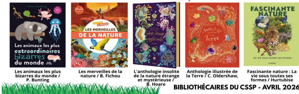
Les animaux les plus extraordinaires bizarres du monde / P. Bunting