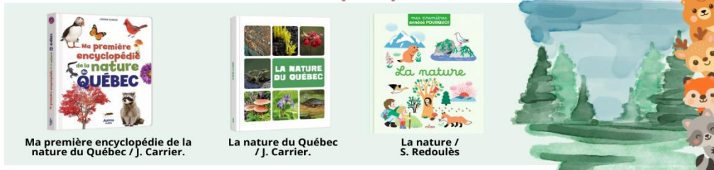
Ma première encyclopédie de la nature du Québec / J. Carrier.